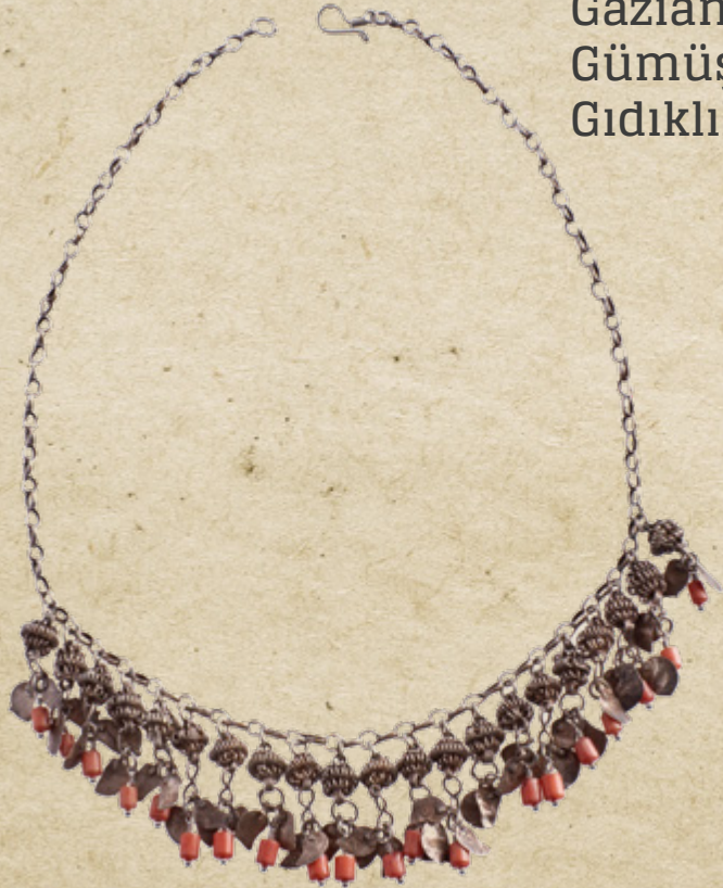
Gaziantep yöresi Gümüş ve mercan işlemeli Gıdıklık