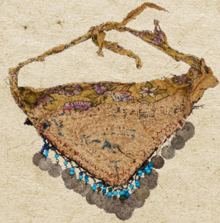
19. Yüzyıl Anadolu Alevi Kemberbest