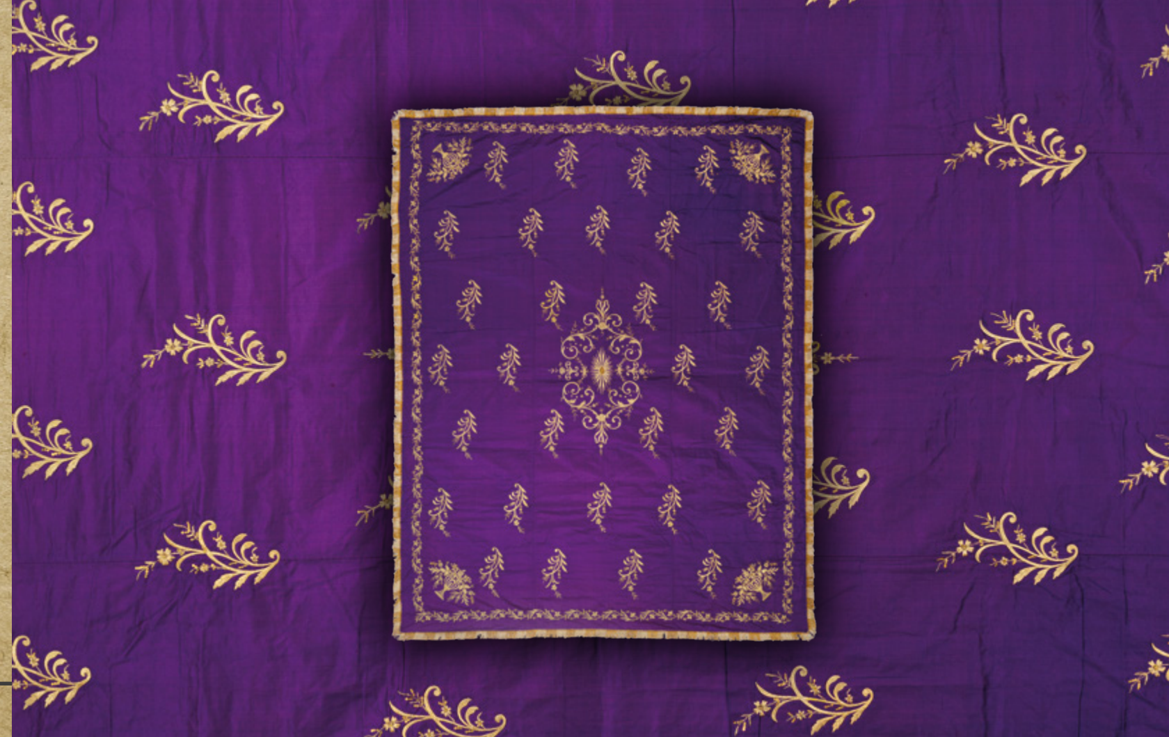
Ankara yöresi, İpek atlas dival işi Yatak örtüsü