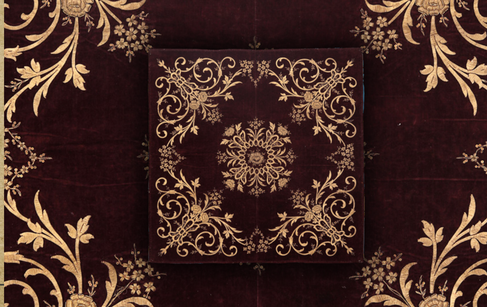
İpek kadife üzeri dival işi Nişan bohçası