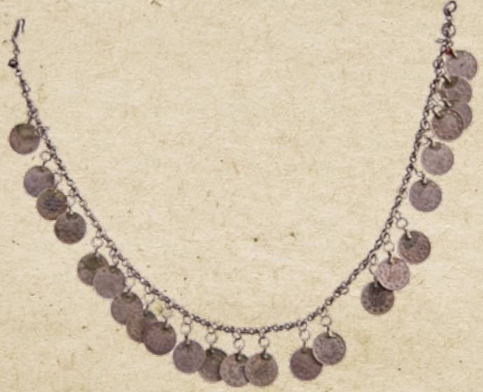
Urfa yöresi, Gümüş para ve zincir işlemeli Yanak döven