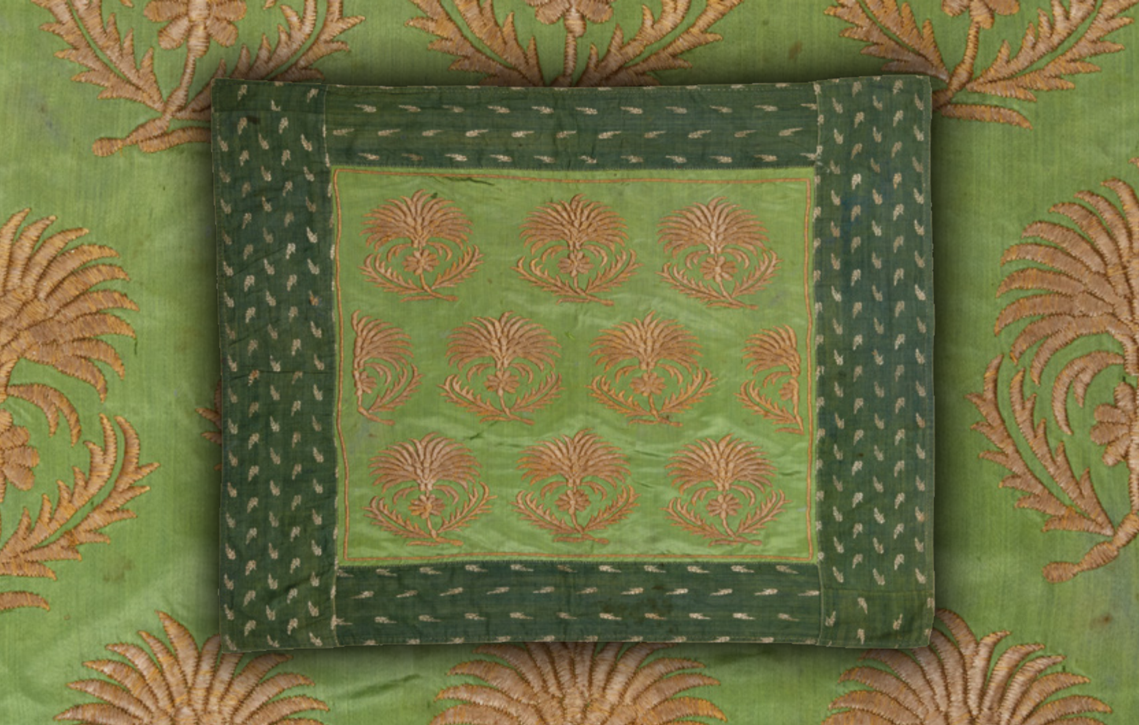
İpek üzeri dival işi Kuran bohçası