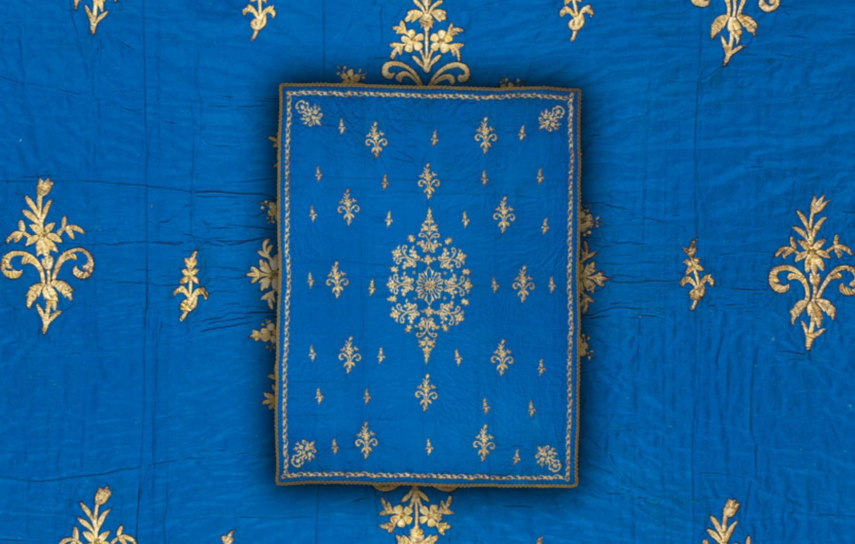
Kayseri yöresi, İpek atlas üzeri dival işi Yatak örtüsü